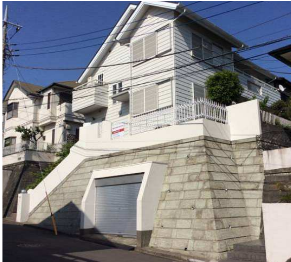
外観 シャッター付き大型地下車庫