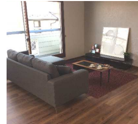
明るい2階リビング