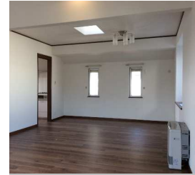
トップライトのあるダイニング