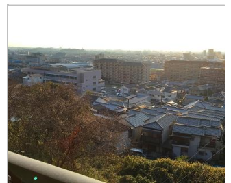
2階バルコニー風景