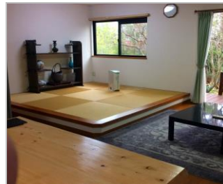
リビング・茶の間