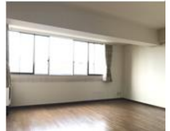
リビングダイニング (現況)